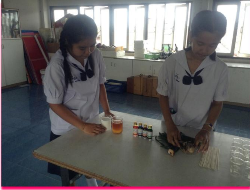
ภาพที่ 1 แสดงคณะผู้จัดทำช่วยกันจัดเตรียมอุปกรณ์อย่างตั้งใจ