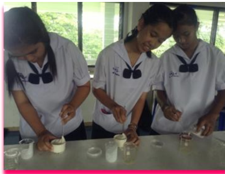
ภาพที่ 6 แสดง คณะผู้จัดทำช่วยกันทำกาวยังตั้งใจ