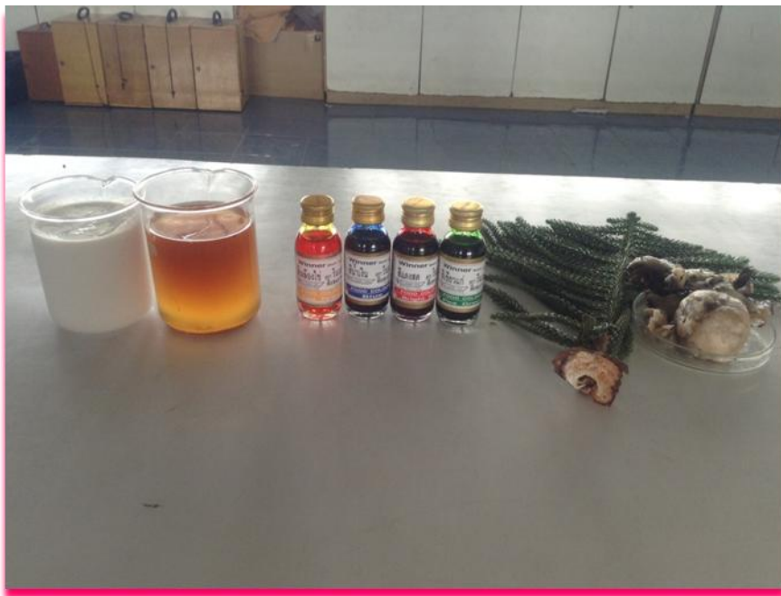
ภาพที่ 2 แสดงเตรียมส่วนผสมที่ใช้ในการทำกาวพิชิตแมลงตัวร้าย ได้แก่ น้ำยาล้างจาน น้ำมันเหลือใช้ สีผสมอาหาร และยางสน ตามลำดับ