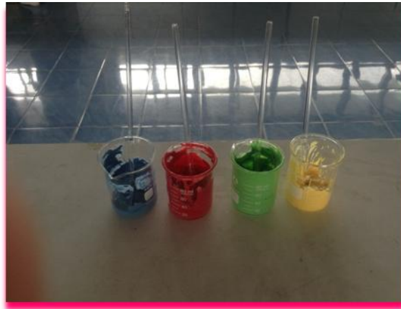
ภาพที่ 9 แสดง ผสมสี ลงในกาวพิชิตแมลงตัวร้าย