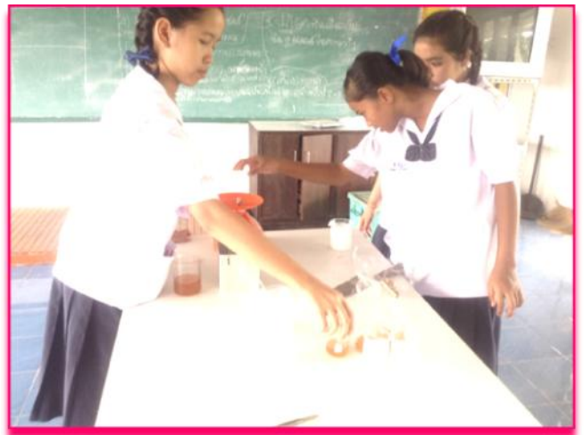
ภาพที่ 4 แสดง สมาชิกในกลุ่มช่วยกันตวงปริมาณของส่วนผสมในการทำกาวพิชิตแมลงตัวร้าย