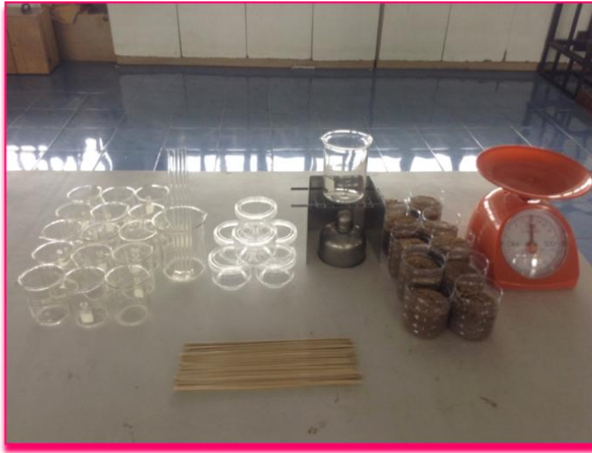
ภาพที่ 3 แสดงการเตรียมอุปกรณ์ที่ใช้ในการทำกาวพิชิตแมลงตัวร้าย ได้แก่ บีกเกอร์ แท่งแก้วคน ภาชนะบรรจุผลิตภัณฑ์ ตะเกียงแอลกอฮอล์ แก้วใส่ทราย และเครื่องชั่งน้ำหนัก