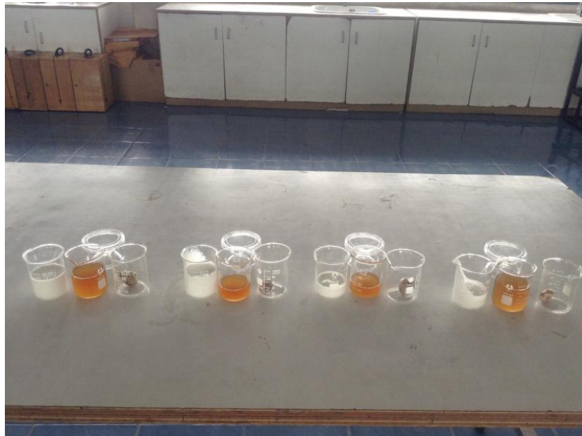
ภาพที่ 5 แสดง สูตรที่ใช้ในการทำกาวยึดแมลงตัวร้าย สูตรที่ 1 สูตรที่ 2 สูตรที่ 3 และสูตรที่ 4 ตามลำดับ