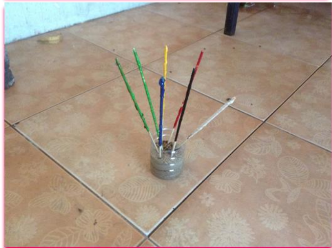
ภาพที่ 11 แสดง ทดลองใช้ผลิตภัณฑ์พืชมงคลตัวร้าย