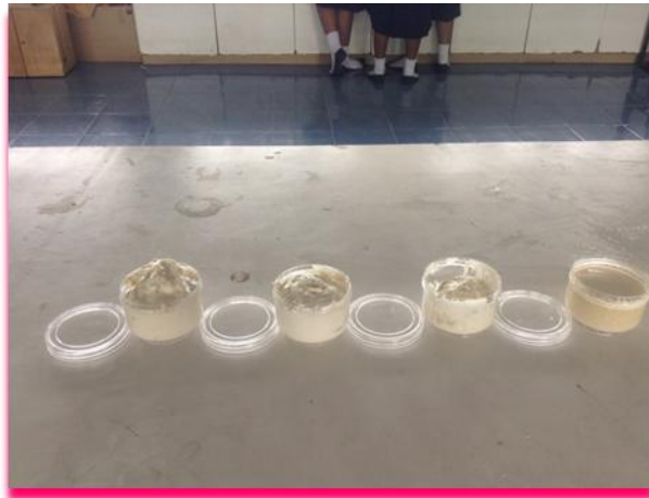
ภาพที่ 7 แสดง กาวที่ทำจาก น้ำยาล้างจาน น้ำมันเหลือใช้ และ ยางสน สูตร 1 สูตร 2 สูตร 3 และสูตร 4 ตามลำดับ