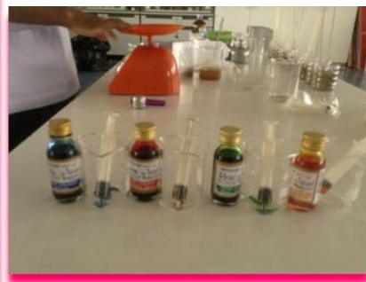
ภาพที่ 8 แสดง สีที่ใช้ในการทำกาวพิจิตแมลงตัวร้าย สีน้ำเงิน สีแดง สีเขียว และสีเหลือง